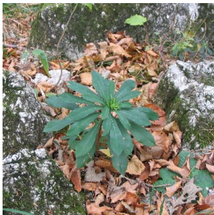
A képen: babér boroszlán a Boroszlán-tanösvényen, 2008 novemberében.

A Százhalom temetője az i.e. 12. században volt használatban, ez a bakonyi késő bronzkori kultúra fénykora. [...]