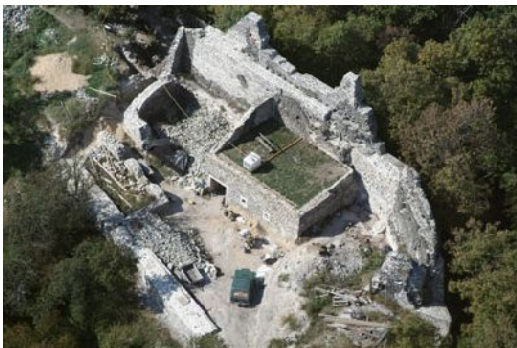
Tátika vára