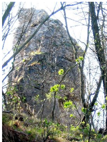
A malom-völgyi „Ember-kő”